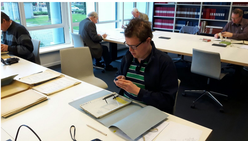
Werkplek in de studiezaal van Het Utrechts Archief te Utrecht.

De Stichting heeft een voorgeschiedenis en deze laat duidelijk zien dat met de oprichting ervan een noodzakelijke volgende stap is genomen. Het begon in 2005 met het fotograferen van de Houtense infrastructuur. Foto's en verhalen werden tussen 2005 en 2014 gepubliceerd op de website www.HoutenInZicht.nl . Deze foto's vormen een omvangrijk historisch document en zijn een belangrijke aanvulling op de collecties historische prenten, prent-briefkaarten en foto's. In 2010 begon de interesse voor de herkomst en betekenis van de straatnamen in de gemeente Houten, als gevolg daarvan werd de stap naar het archief gemaakt en werd begonnen met het documenteren van de gegevens. Vanaf 2014 is de website www.HoutenseHodoniemen.nl in de lucht. De site toont projecten, waarbij de voortgang met foto's en verhalen over het gedane onderzoek en de onderzoeksresultaten worden getoond. Er wordt elk kwartaal nieuwe informatie aan toegevoegd. Op de site is een lange lijst van afgeronde projecten te vinden en deze lijst groeit nog steeds.