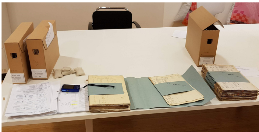
Werkplek in de studiezaal van het Nationaal Archief te Den Haag.