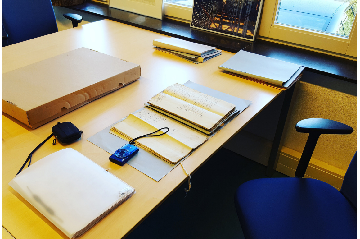
Werkplek in de studiezaal van het Regionaal Historisch Centrum Zuidoost Utrecht te Wijk bij Duurstede.