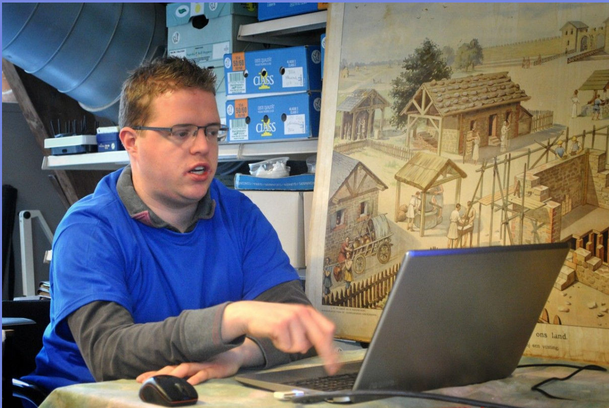
Presentatie straatnamen van Houten Castellum bij de Archeologische Werkgroep Leen de Keijzer in het Oude Station van Houten, voorjaar 2016.

Enmaal het dossier of de omslag op de tafel ga ik eerst na wat erin zit om te beoordelen wat ik nodig heb voor informatie. Als ik dat heb vastgesteld dan fotografeer ik de stukken met mijn compactcamera. Tot begin 2016 deed ik dit met mijn spiegelreflexcamera maar dat was toch een te groot object om elke keer naar het archief te slepen. Op het archief in Utrecht klaagde ze een keer dat mijn camera teveel geluid maakte. En of dat geluid niet uitgezet kon worden. Maar dat kon niet. Het bleek te gaan om het geluid van het omslaan van de spiegel in de spiegelreflexcamera.